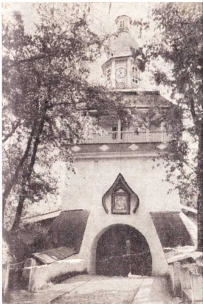
Главный вход в монастырь — Петровские ворота. В эти ворота прошли тысячи людей с надеждой на божью помощь, через эти ворота они уходили, не получив ее.