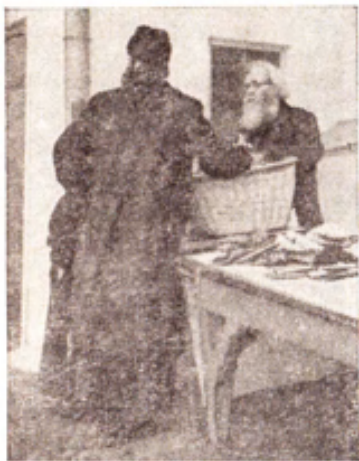
Обмен «опытом». Сборщик приношений (с корзиной в руках) беседует с приемщиком заздравно-заупокойных заказов.

мый нам отец Серафим. Ассортимент весьма обширный: нательные крестики — от жестяных, двухрублевых, до позолоченных, дорогих, образки, иконы, богоугодная литература, поминально - заздравные книжки и прочая смесь для душе-спасительного сервиса.