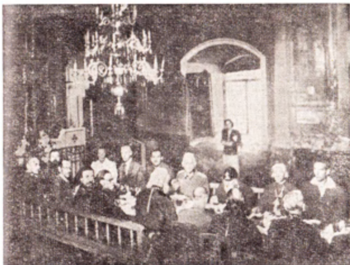
Святые отцы за одним столом с гитлеровцами. Открытие архипастырского совещания в Сретенском храме 28 августа 1943 года.

на. Ко дню рождения Гитлера он посылает ему от имени всей монашеской братии поздравительную телеграмму и коллективный подарок. В ответ через псковского гебитскомиссара пришло следующее подтверждение: «Канцелярия Фюрера уполномочила меня передать вам благодарность за поздравление и присланный вами подарок ко дню рождения Фюрера».