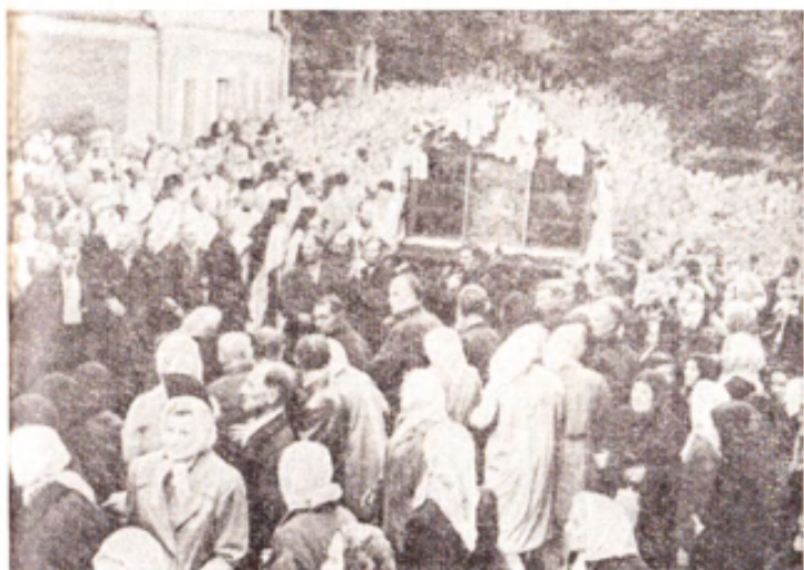
Чудотворная! Это к ней съезжаются верующие из разных уголков страны.