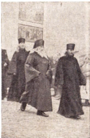
Для святых отцов время — по- длинно деньги. Святые отцы спе- шат в божий храм на богослу- жение.

В области церковных служб я дилетант, всех достоинств вечерни по заслугам оценить не могу. Один отец мелодичным тенорком