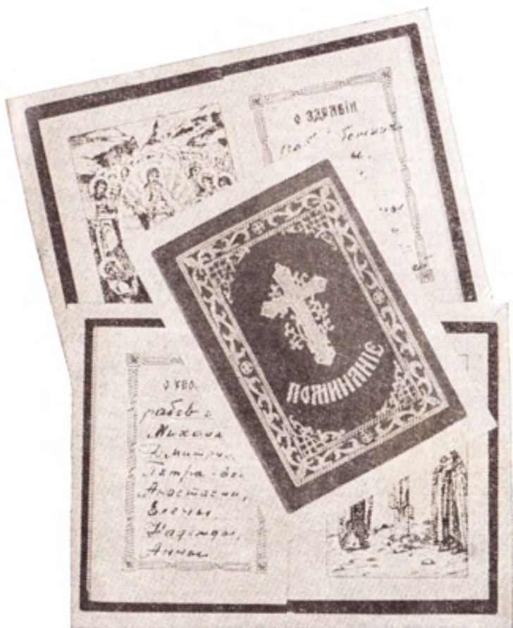
Такими заздравно-поминальными книжками бойко торгуют монастырские служки.