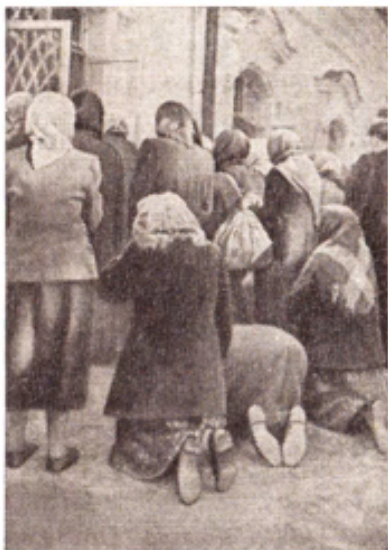
Замаливая грехи и прося о милости... На монастырском дворе.

налево в нишах целая галерея икон. Слабо мерцают лампы, тускло блестит потемневшая от времени позолота. С покрытых трещинами, облупившихся досок гипнотизирующе взирают лики святых. Старушки богомолки останавливаются, истово крестятся, бьют поклоны. Но что за наваждение? Идущая впереди меня дородная молодая женщина следует примеру старушек. Даже глаза закатывает от умиления и блаженного экстаза. Ярко напыженные лилового цвета губы, модельные туфли на каблуках-шпильках, в руках модная бархатная сумочка, в ушах крупнокалиберные клипсы, очень похожие на жестяные пробки от лимонадных бутылок, пластмассовое кольцо сжимает на макушке игриво изо-